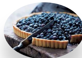
La tarte aux myrtilles