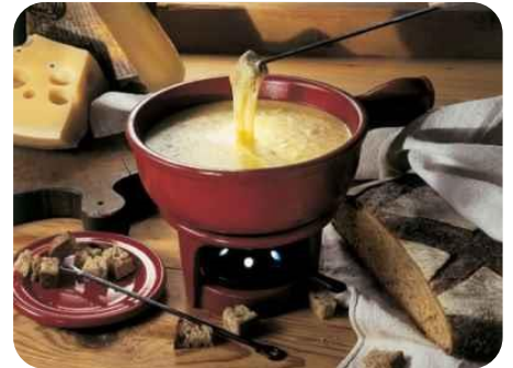
La fondue savoyarde

La fondue savoyarde est à la base un plat qui était constitué de vieilles croûtes de fromage, de vieux croûtons de pain et d'un fond de tonneau de vin blanc car c'était uniquement ce qu'il restait dans les garde-mangers des paysans à la fin de l'hiver. On constituait donc un plat avec tous ces éléments mélangés. Aujourd'hui, la fondue se compose de trois fromages : le comté, l'emmental et le beaufort, que l'on fait fondre dans un poêlon avec du vin blanc et parfois un peu de génépi. Ensuite il suffit de plonger quelques morceaux de pain rassis dans la préparation et de déguster.