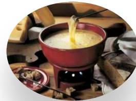
La fondue savoyarde