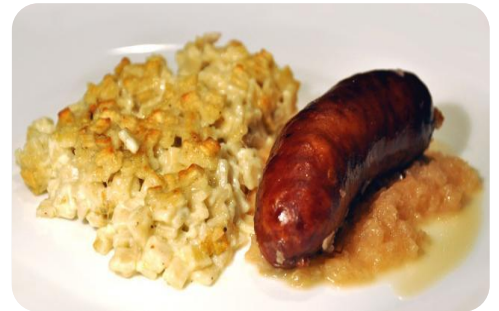
Diots aux crozets

Les diots sont des saucisses typiquement savoyardes, à la chair rose qui peuvent être de différentes variétés (nature, fumé...). Elles sont généralement accompagnées de polenta, de pommes de terre ou de crozets, qui sont de petites pâtes carrées fabriquées à base de farine de sarrasin ou parfois de blé dur et d'œufs.