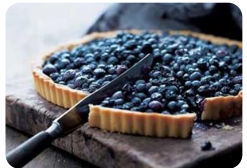
La tarte aux myrtilles

La tarte aux myrtilles est l'un des desserts typiques des régions montagneuses où poussent les myrtilles. Elle est faite avec une pâte sablée généralement garnie de crème pâtissière mélangée aux myrtilles et est souvent servie avec un peu de crème fraîche.