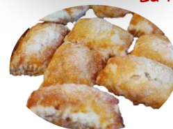
Les rissoles savoyardes