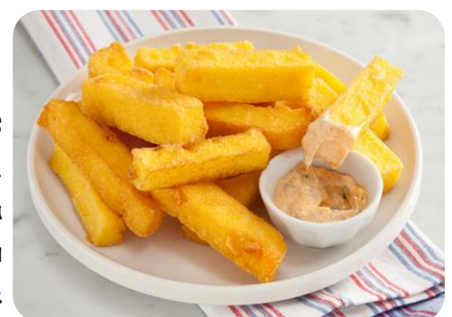
Frites de polenta

La polenta, ou polente, est une semoule de maïs originaire d'Italie mais très appréciée par les savoyards. Elle se présente sous forme de galette ou de bouillie à base de semoule ou de farine de maïs. Nature ou crémeuse, elle est servie en purée, en galettes ou encore en frites revenues à la poêle. Elle est parfois servie avec des diots. La polenta peut également être dégustée en dessert : gâteaux, flans... .