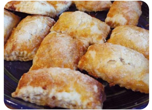
Les rissoles savoyardes

Les rissoles sont des pâtisseries savoyardes à base de compote de poires dites « poires à rissoles ». Ces poires ont la particularité d'être très dures et de ne pouvoir être mangées que cuites, et leur chair rougit à la cuisson. On en fait une compote agrémentée de diverses épices et de sucre que l'on place dans une pâte feuilletée, souvent dorée à l'œuf, puis on les fait cuire au four. Auparavant les rissoles étaient les desserts traditionnels de Noël dans la région de Chambéry.