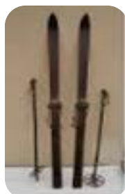
Ski années 1930-40

« Nous devons aux scandinaves le ski à la spatule recourbée et effilée. En 1932, l'adjonction de carres métalliques sur les arêtes inférieures du ski évite une usure des parties tendres du bois et apporte une plus grande précision dans la conduite du ski.