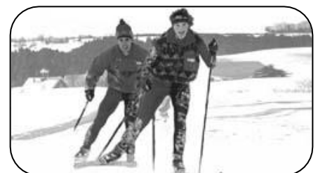
Course de ski