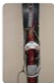
Fixation années 1950