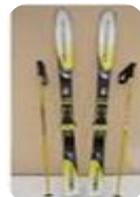
Ski années 2000