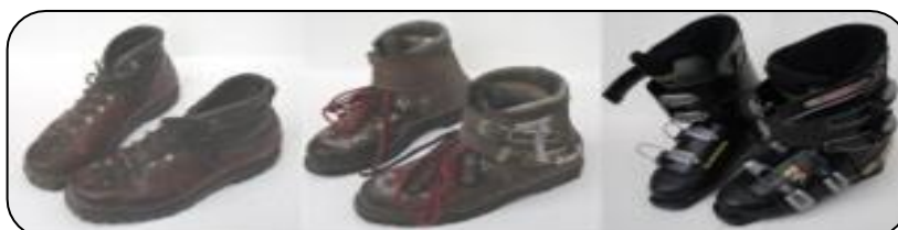
Évolution des chaussures de ski alpin