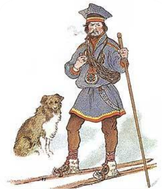
Skieur lapon gardant son troupeau de rennes

Les Lapons se servaient quant à eux des skis pour poursuivre les troupeaux sur les grandes étendues de neige.