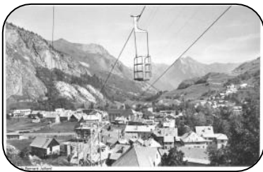
Télébenne Juliard à Valloire

C'est bien le tourisme et non le ski qui a présidé à la naissance des premières stations. Ces dernières furent d'ailleurs, à l'exception de Chamonix, des centres de thermalisme dotés d'un accès par chemin de fer (Saint-Moritz, Saint-Gervais, Aix-les-Bains, Cauterets, Bagnères). La mode du ski va surtout se développer pendant l'entre-deux-guerres.